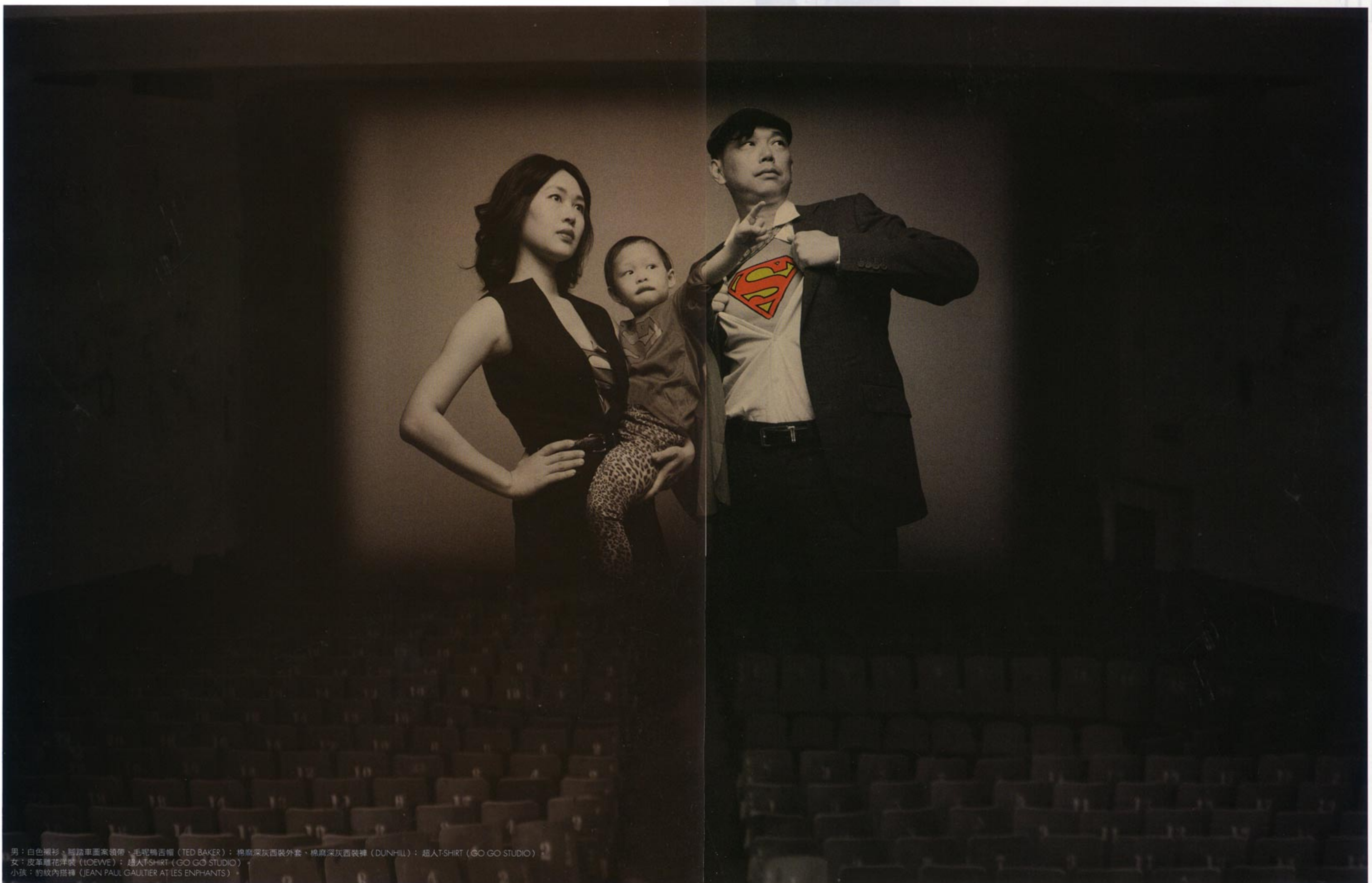
男：白色襯衫、腳踏車圖案領帶、毛呢鴨舌帽 (TED BAKER)；棉麻深灰西裝外套、棉麻深灰西裝褲 (DUNHILL)；超人T-SHIRT (GO GO STUDIO) 女：皮革雕花洋裝 (LOEWE)；超人T-SHIRT (GO GO STUDIO) 小孩：豹紋內搭褲 (JEAN PAUL GAULTIER AT LES ENPHANTS)